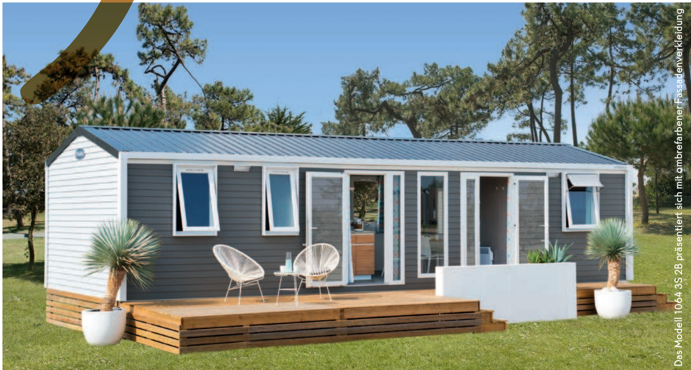
Das Modell 1064 3S 2B präsentiert sich mit ambrefarbener Fassadenverkleidung

3 | 6 | 38,40 m 2 | 10,62 x 4 m | 2018 SCHLAFZIMMER | SCHLAFPLÄTZE | INNENFLÄCHE | MASSE