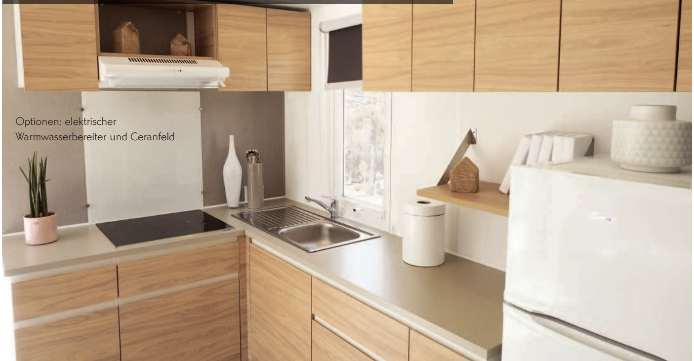
Optionen: elektrischer Warmwasserbereiter und Ceranfeld