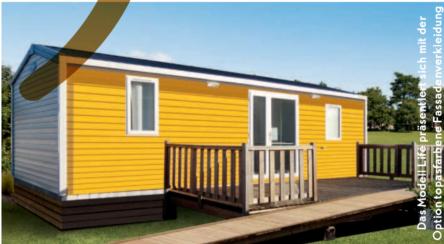
Das Modell Life präsentiert sich mit der Option topfarbene Fassadeverkleidung

2 SCHLAFZIMMER | 4 bis 6 SCHLAFPLÄTZE | 30,50 m 2 INNENFLÄCHE | 8,49 x 4 m MASSE | 2018