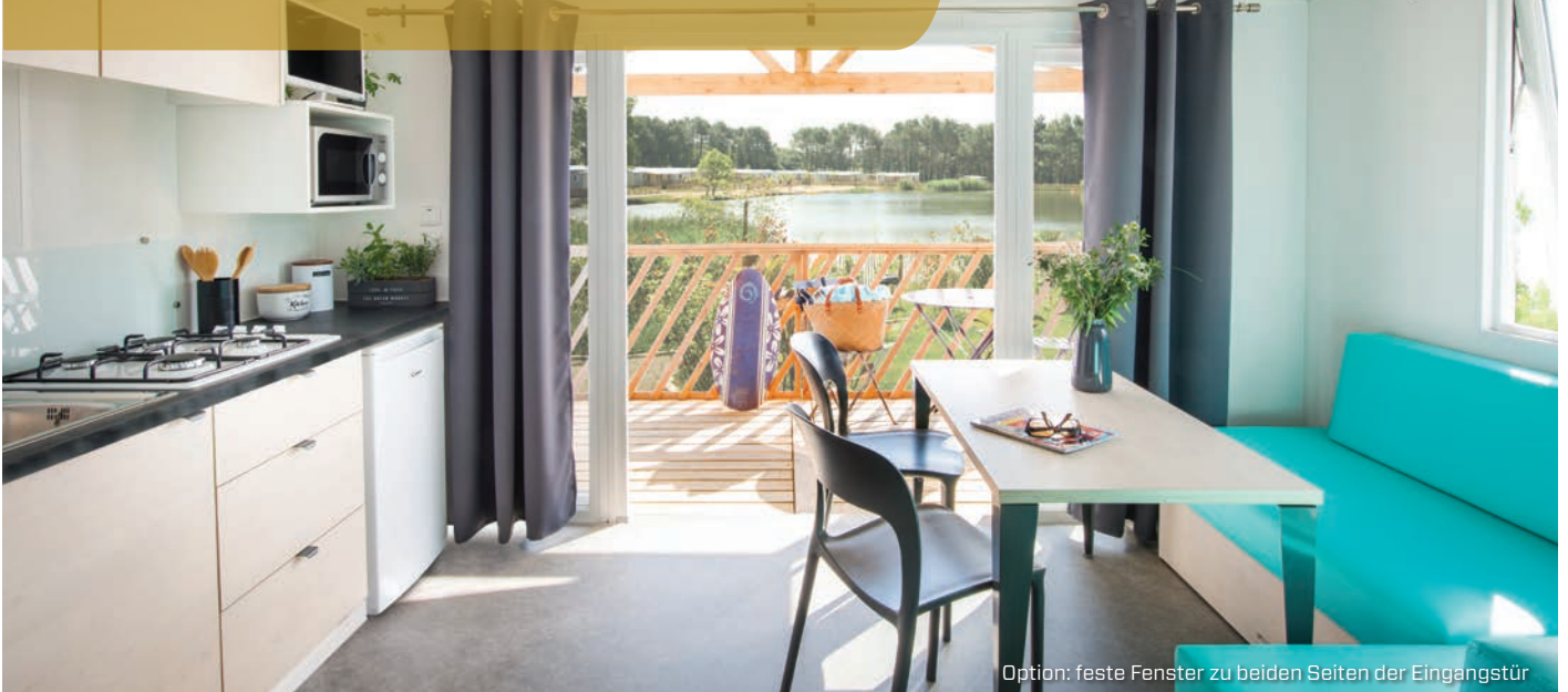
Option: feste Fenster zu beiden Seiten der Eingangstür