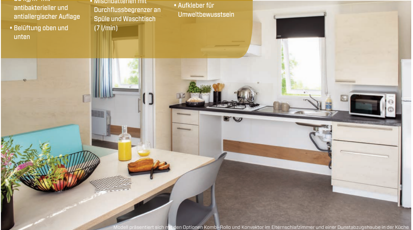
Modell präsentiert sich mit den Optionen Kombi-Rollo und Konvektor im Elternschlafzimmer und einer Dunstabzugshaube in der Küche