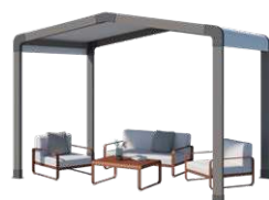
Espace de détente