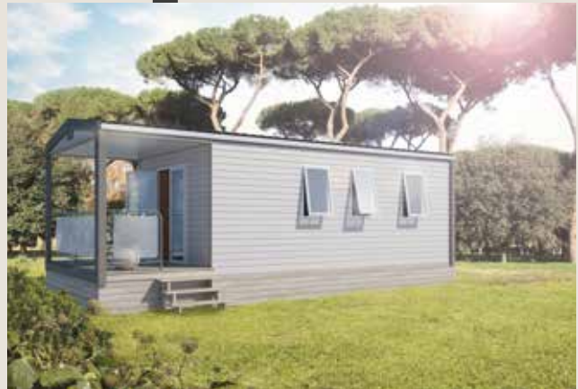
Modell mit optionalem Geländer aus Metall mit Segeltuch