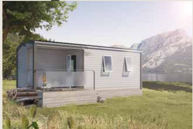
Modell mit optionalem Geländer aus Metall mit Segeltuch

Die Herausforderung eines kompakten Modells mit integrierter Terrasse