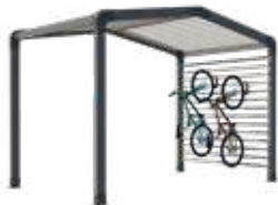
Bereich zum Abstellen von Fahrrädern und/oder zur Lagerung